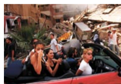
World Press Photo of the year 2006, Spencer Platt, USA, Getty Images

O melhor do fotojornalismo mundial numa exposição que é o retrato fiel, por vezes crú e dramático, outras vezes belo e empolgante, do mundo em que vivemos